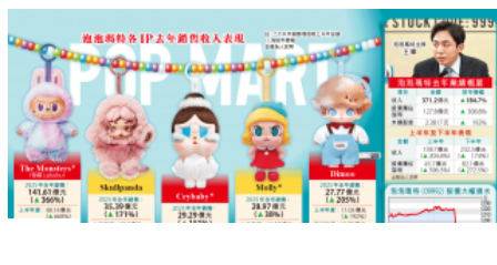
泡泡瑪特瀉22% 今年高增長不再 今日信報