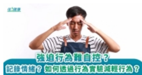
強迫行為難自控？ 潘錦珊 | 信健康